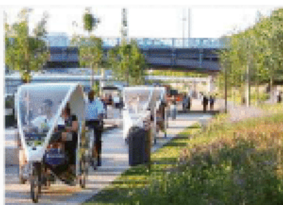
Berges du Rhône