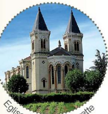
Eglise de Régnié-Durette